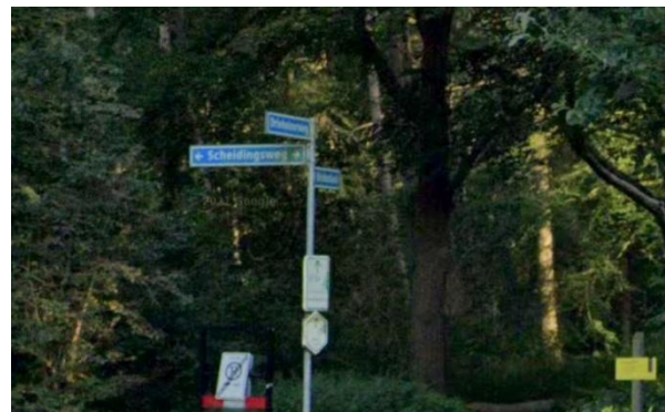
Bron: Street View - aug. 2021

De plattegronden (vanaf 1939) bevatten tegenstrijdige informatie. Bij Kompas (1948 t/m 1962), Omnium (1964 t/m 1969) en Smulders Kompas (1970 t/m 1981) ligt de grens bij de spoorlijn, maar bij Cito (1942 t/m 1964), idem 1e t/m 4e editie (2000 t/m 2012) en bij Falk 1e t/m 27e druk (1978 t/m 2010) loopt de Sionsweg door tot de Driehuizerweg.